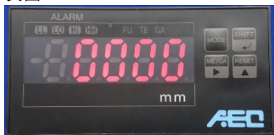
現行 73SS 型 表面