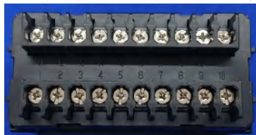
端子台（ビス脱落防止タイプ）